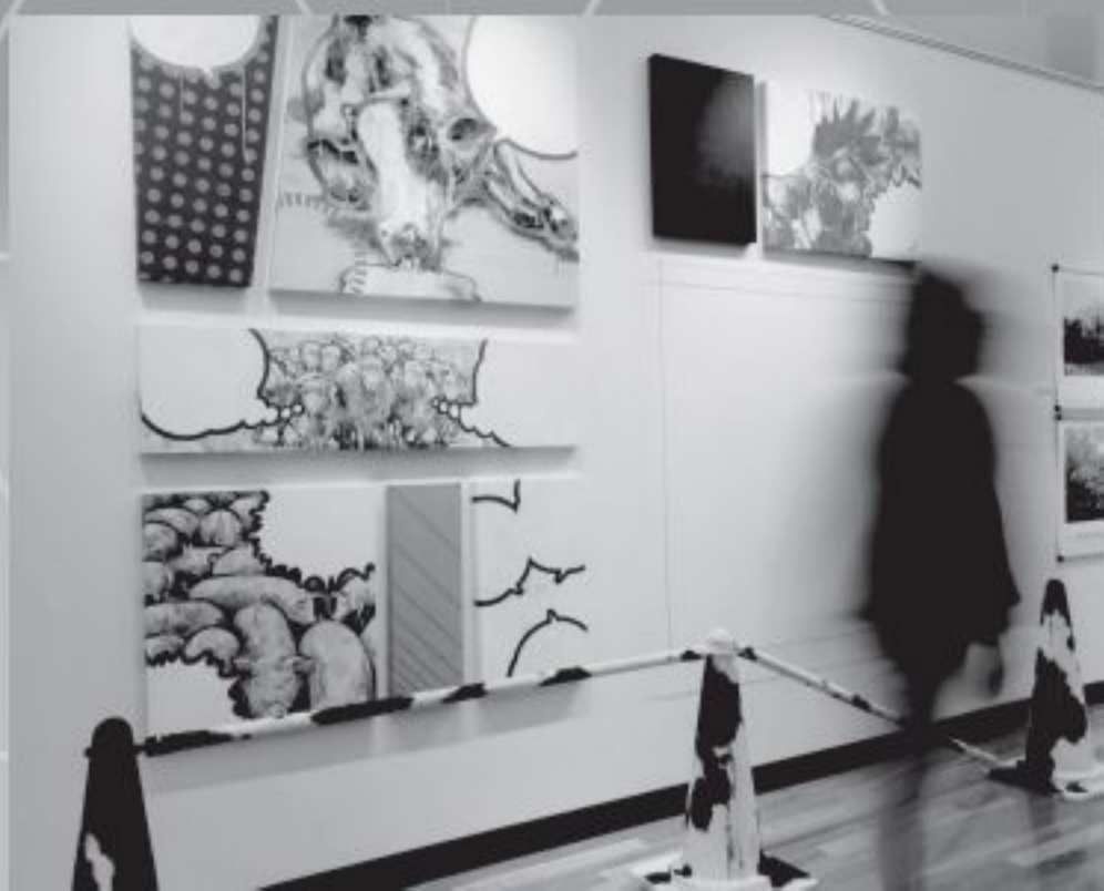
Kit_A (a.k.a.YOSHIKI KITA)